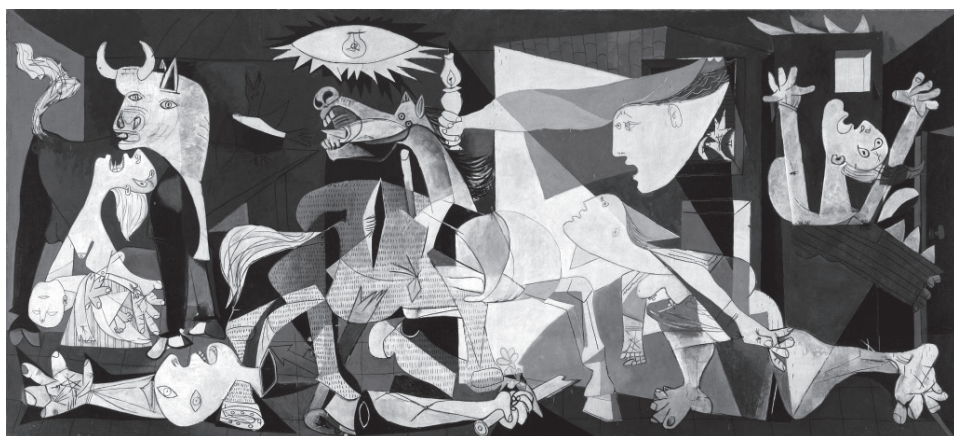
Rys. 2. Pablo Picasso, Guernica 18 .

Muzeum Narodowego Centrum Sztuki Królowej Zofii w Madrycie obraz powstał w 1937 r. Dzieło jest wyrazem artystycznego hołdu, jaki został złożony baskijskiemu miastu Guernica, które zostało zbombardowane przez Niemców 26 kwietnia 1937 r. podczas hiszpańskiej wojny domowej 17 . Obraz P. Picassa pokazuje, do czego prowadzi nienawiść – uczucie, o którym często mówią skazani jako o emocji trudnej do opanowania i będącej częstym motywatores czynów przestępczych. Dzieło wywiera ogromny wpływ na oglądających je, niosąc w sobie wołanie o pokój i dobro. Wśród wielu symbolicznych postaci widniejących na obrazie warto w czasie zajęć resocjalizacyjnych zwrócić uwagę na kilka z nich.