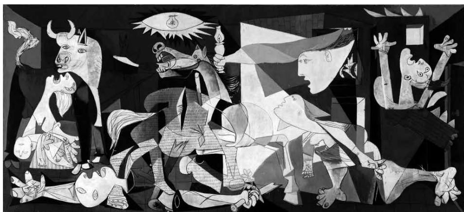
Rys. 2. Pablo Picasso, Guernica 18 .

Muzeum Narodowego Centrum Sztuki Królowej Zofii w Madrycie obraz powstał w 1937 r. Dzieło jest wyrazem artystycznego hołdu, jaki został złożony baskijskiemu miastu Guernica, które zostało zbombardowane przez Niemców 26 kwietnia 1937 r. podczas hiszpańskiej wojny domowej 17 . Obraz P. Picassa pokazuje, do czego prowadzi nienawiść – uczucie, o którym często mówią skazani jako o emocji trudnej do opanowania i będącej częstym motywatores czynów przestępczych. Dzieło wywiera ogromny wpływ na oglądających je, niosąc w sobie wołanie o pokój i dobro. Wśród wielu symbolicznych postaci widniejących na obrazie warto w czasie zajęć resocjalizacyjnych zwrócić uwagę na kilka z nich.