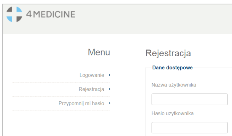
Rysunek 1 Panel rejestracji