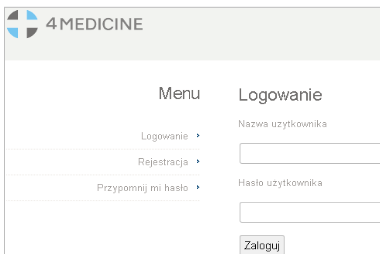
Rysunek 2 Panel logowania

Dostęp do konta w systemie edytorskim JournalsTube możliwy jest poprzez stronę: http://platform.4medicine.pl/index.php/manuscripts/set-journal-id/journal_id/2