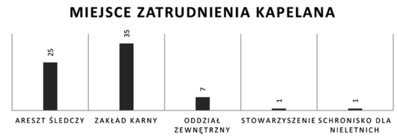
Wykres 4. Miejsca zatrudnienia kapelanów więziennych

Odnosząc się do kwestii zatrudnienia: 1 kapelan w stowarzyszeniu, 1 w schronisku dla nieletnich, a pozostałych 25 kapelanów w Areszcie Śledczym, 35 kapelanów w Zakładzie Karnym, posługę w Oddziale Zewnętrznym zadeklarowało 7 – z tym, że kilku kapelanów pracuje w dwóch jednostkach – zarówno w AŚ, jak i w ZK czy OZ.