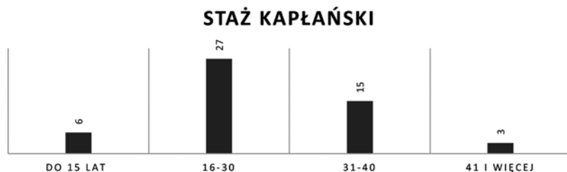
Wykres 2. Staż kapłański kapłanów więziennych

Staż kapłański badanych kształtował się następująco: najkrótszy – 8 lat, a najdłuższy – 47 lat