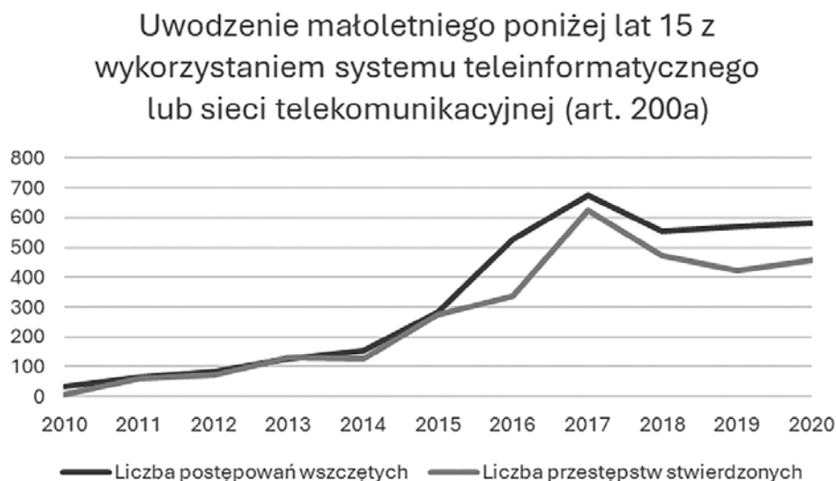
Wykres 1. Liczba przestępstw z art. 200a KK w latach 2010–2020