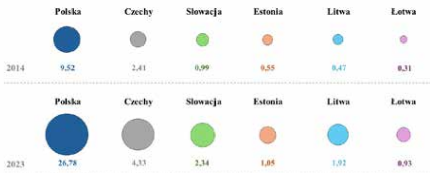
Rysunek 1. Wzrost wydatków obronnych w wybranych państwach Europy Środkowo-Wschodniej w latach 2014–2023.